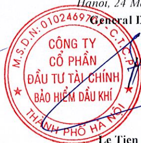
Le Tien Hung