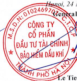
Le Tien Hung